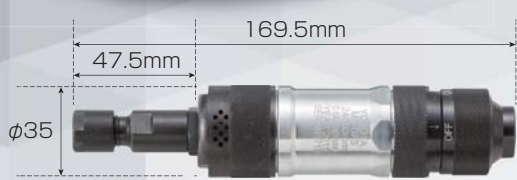
MG-0AS (ロール式グリップ)

MG-0AS、0AL、0AEシリーズは従来の軸付砥石専用機種よりも、芯ブレ精度にこだわり、高精度チャックを採用、作業性や安全性を飛躍的に向上させ、超硬ロータリーバーの使用が容易になりました。