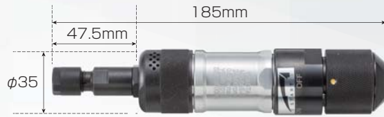
MG-0AS-R (セーフティスロトル式グリップ)