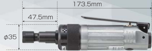
MG-0AL (レバー式グリップ)